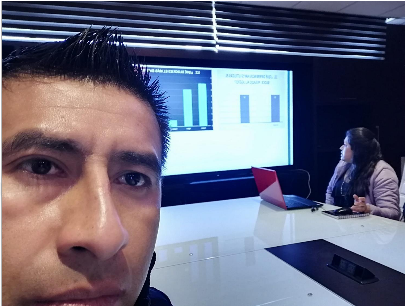
Seguimiento y evaluación del proyecto “Optimización de fabricación de block”.