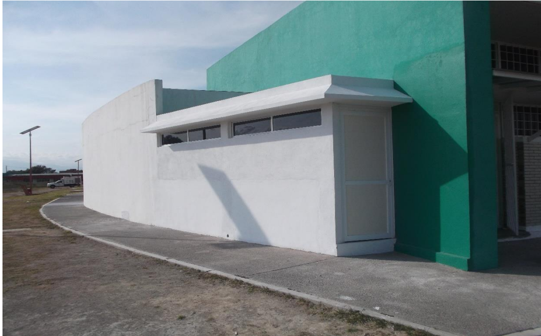
OBRA CONCLUIDA DEL ALMACEN DE REACTIVOS EN EL EDIFICIO DE LABORATORIOS Y TALLERES LT-2