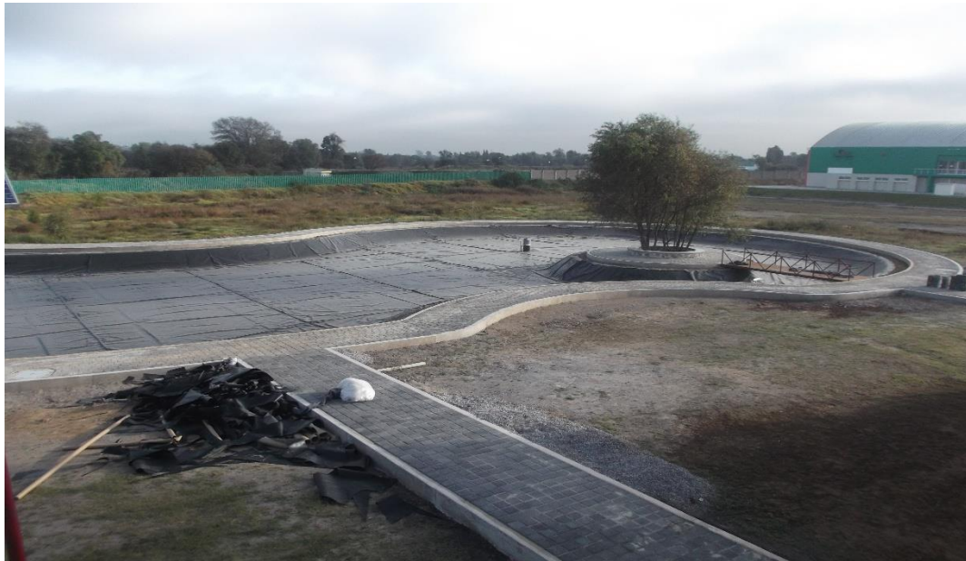
COLOCACIÓN DE GEOMALLA POLIETILENO ALTA DENSIDAD PARA CONTENER EL ANEGADO DEL LAGO