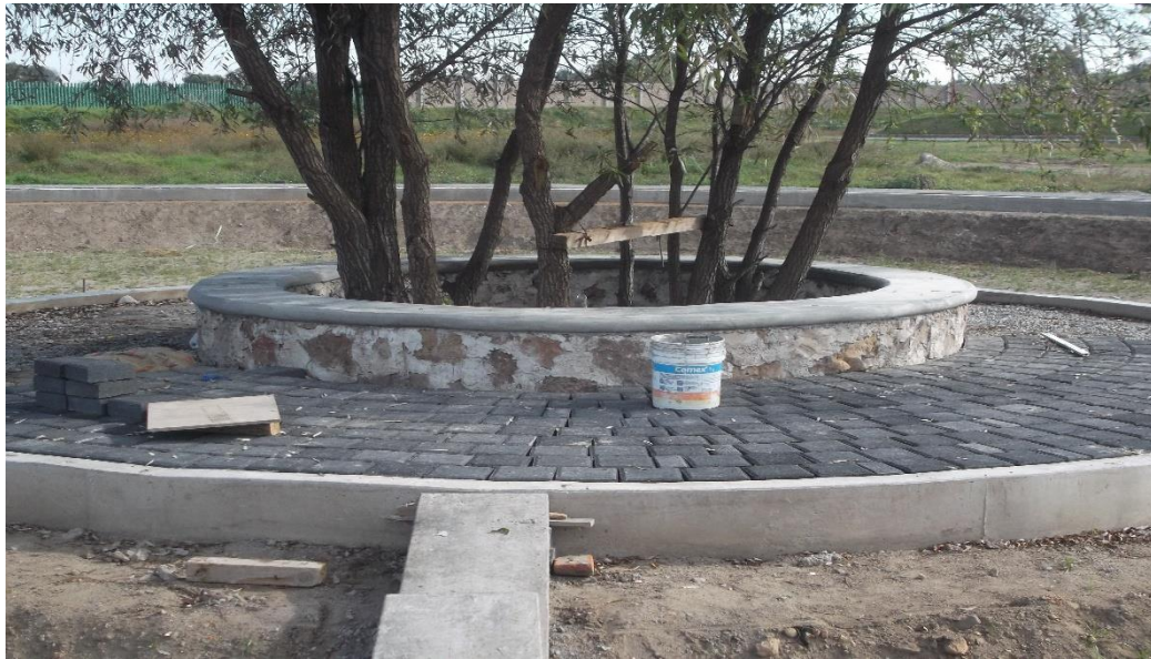
RODAPIE DE PIEDRA BRAZA, MESETA DE CONCRETO Y COLOCACIÓN DE ADOCRETO EN ISLETA EXISTENTE.