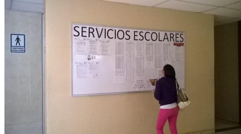
Aplicación de Examen Ceneval ciclo intermedios y publicación de listas de aceptados.