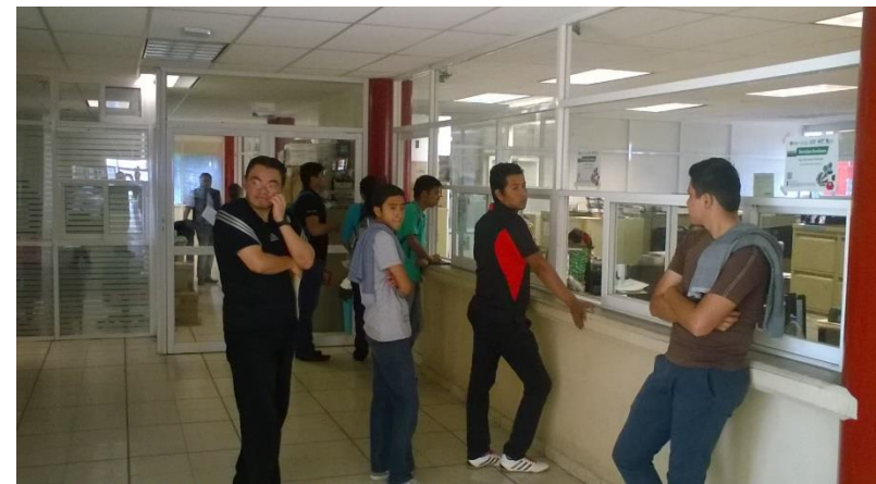
Solicitudes de exámenes de recuperación.