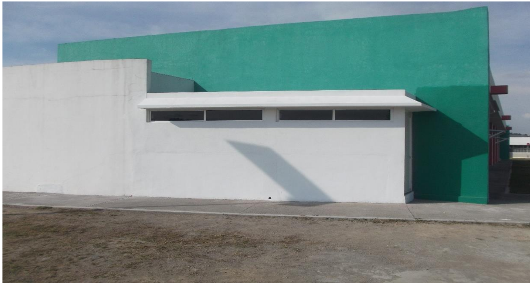
OBRA CONCLUIDA DEL ALMACEN DE REACTIVOS EN EL EDIFICIO DE LABORATORIOS Y TALLERES LT-2