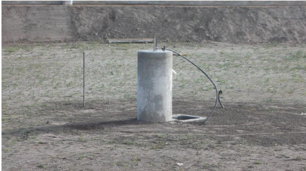
COLUMNA CIRCULAR DE CONCRETO PARA LA INSTALACIÓN DE BOQUILLA TIPO TULIPAN CROMADA.