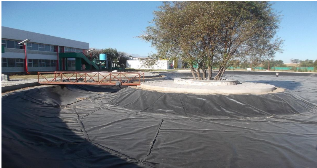
VISTA PANORAMICA DEL PUENTE METÁLICO, COLOCACIÓN DE GEOMEMBRANA E ISLETA EXISTENTE