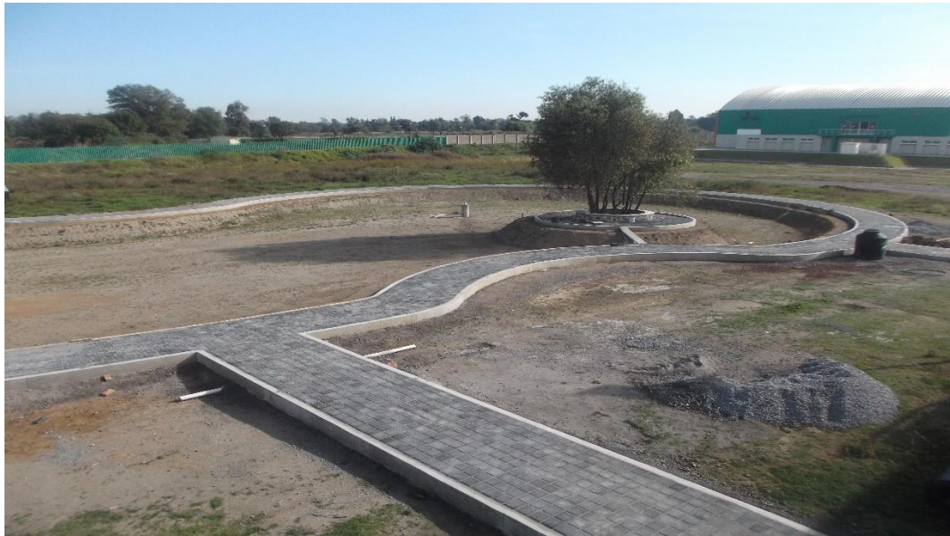
VISTA PANORAMICA DE ANDADORES CON PAVIMENTO DE ADOCRETO DEL LAGO ARTIFICIAL.