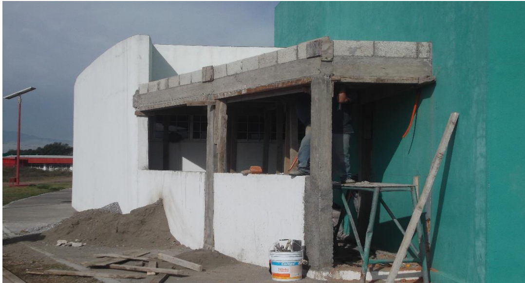
CONSTRUCCIÓN DE ALMACEN DE REACTIVOS EN EL EDIFICIO DE LABORATORIOS Y TALLERES LT-2