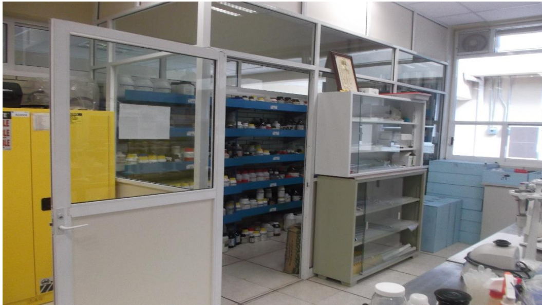
ÁREA IMPROVISADA PARA ALMACENAMIENTO DE REACTIVOS EN EL LABORATORIO DE BIOTECNOLOGÍA.