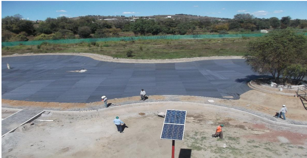
COLOCACIÓN DE MALLA GEOTEXTIL PARA LA PROTECCIÓN DE LA GEO MEMBRANA DURANTE EL PROCESO