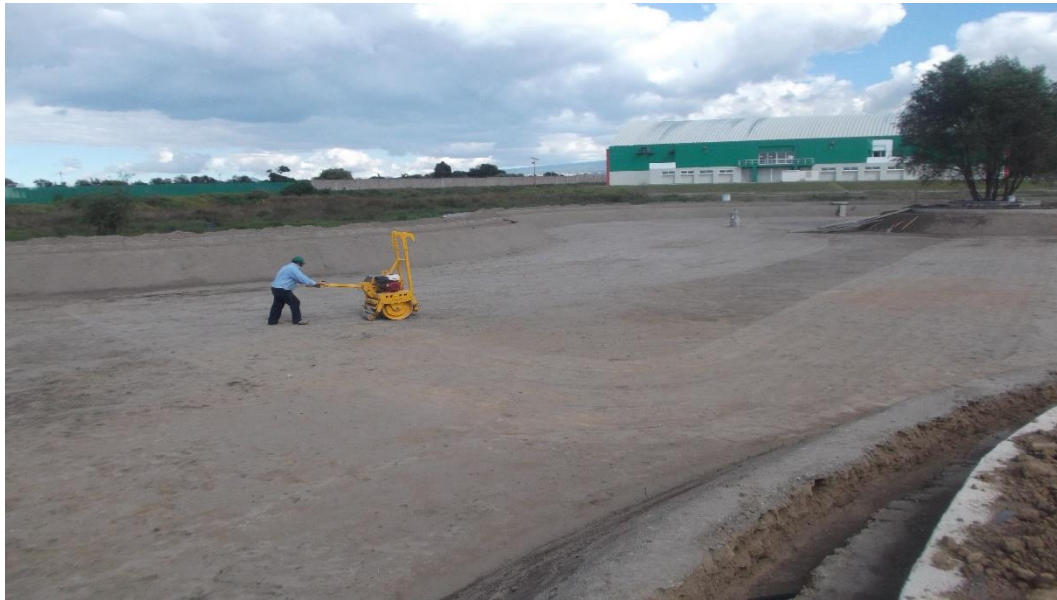
DESHIERBE Y AFINE DEL FONDO DEL LAGO PREVIO A LA COLOCACIÓN DE LA MALLA TEXTIL DE PROTECCIÓN