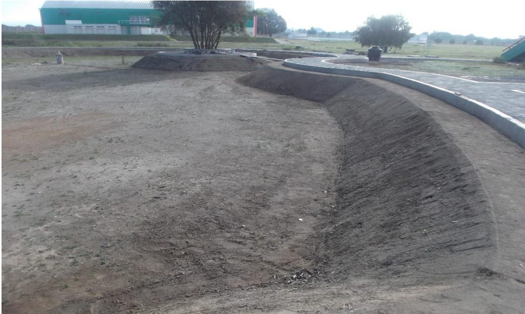
AFINE DE TALUDES Y PAVIMENTO DE ADOCRETO EN ANDADORES PERIMETRALES.