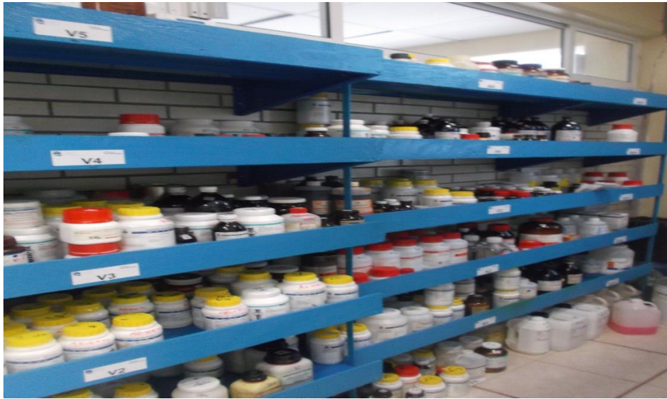
ALMACENAMIENTO DE REACTIVOS QUÍMICOS, SE OBSERVA VENTILACIÓN INADECUADA.