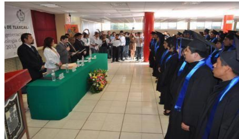
Realización de documentación oficial y protocolo de titulación de diferentes Programa Educativos.