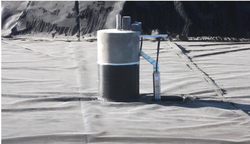
COLOCACIÓN E INSTALACIÓN DE MOTOBOMBA SUMERGIBLE PARA GENERAR EL CHORRO DE AGUA.