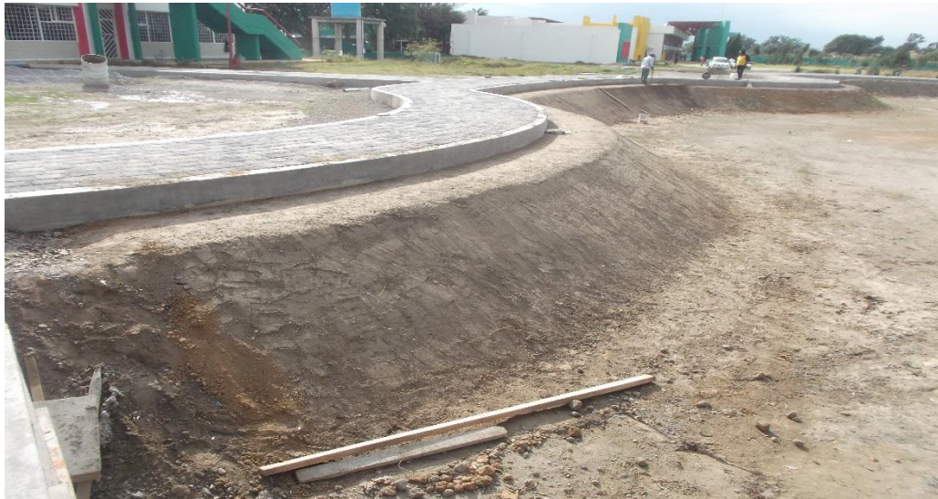
AFINE DE TALUDES PARA RECIBIR LA GEOMEMBRANA DE POLIETILENO ALTA DENSIDAD.