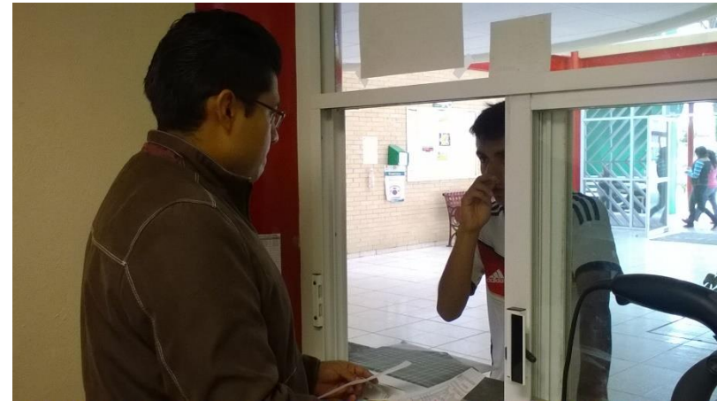
Entrega de fichas de admisión de nuevo ingreso.