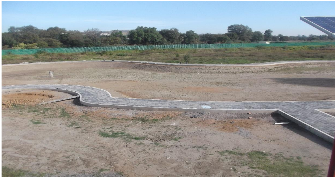
VISTA PANORAMICA DE PAVIMENTO DE ADOCRETO, ANDADORES Y VASO DEL LAGO ARTIFICIAL.