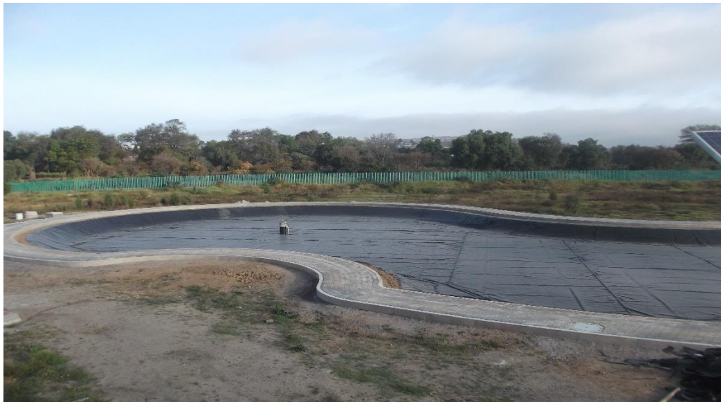
COLOCACIÓN DE GEOMEMBRANA POLIETILENO ALTA DENSIDAD PARA CONTENER EL ANEGADO DEL LAGO