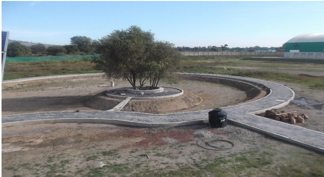
VISTA PANORAMICA DE ISLETA EXISTENTE Y ANDADORES PERIMETRALES CON PAVIMENTO DE ADOCRETO.