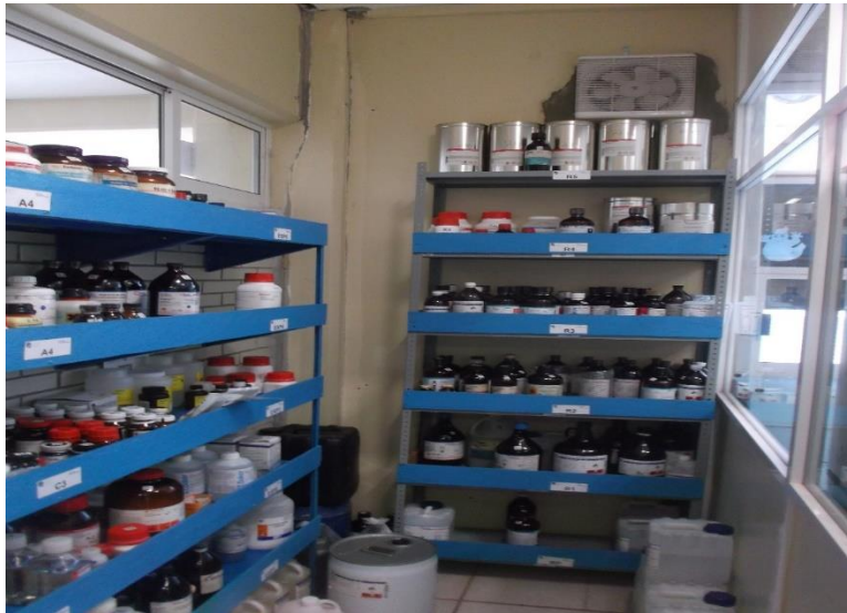
ÁREA IMPROVISADA PARA EL ALMACENAMIENTO DE REACTIVOS QUÍMICOS EN LABORATORIO DE BIOTECNOLOGÍA.