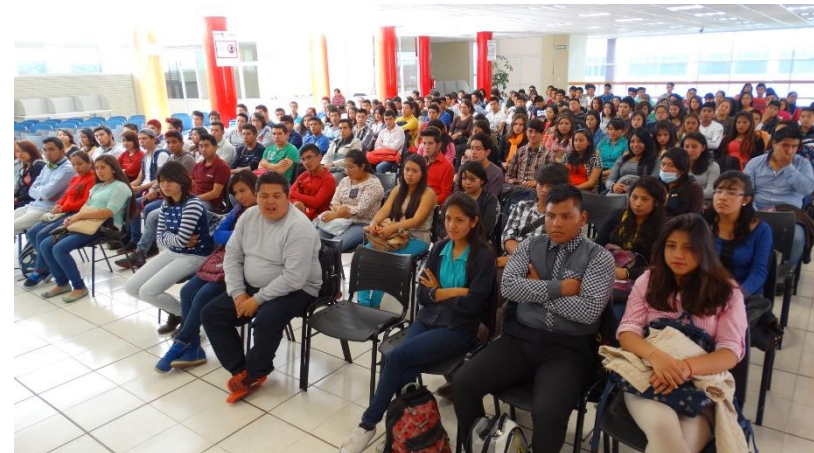
Inscripción de alumnos de nuevo ingreso ciclo intermedio y curso de inducción.