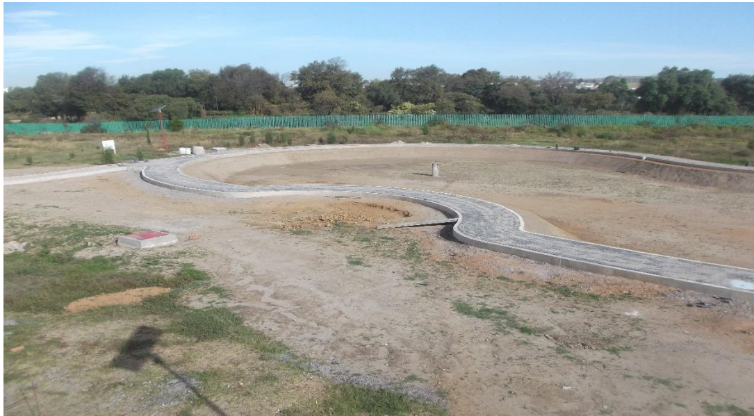
VISTA PANORAMICA DE PAVIMENTO DE ADOCRETO EN ANDADORES PERIMETRALES DEL LAGO ARTIFICIAL.