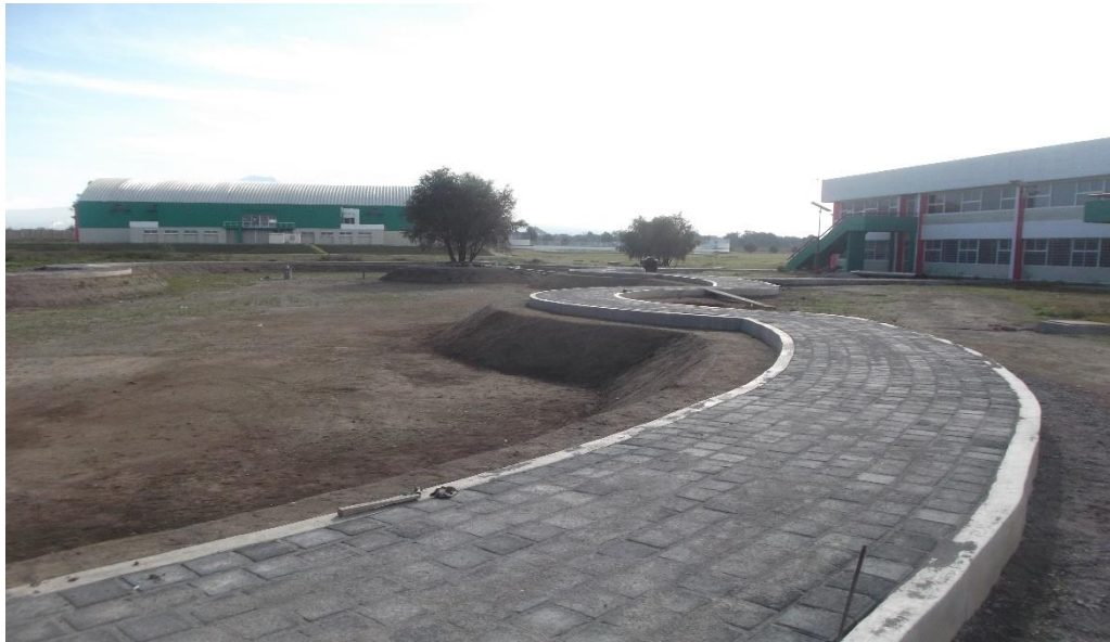
PAVIMENTO CON ADOCRETO SECCIÓN 20X20X8 CM. DE ESPESOR DE 280 KG/CM 2 , EN ANDADORES.