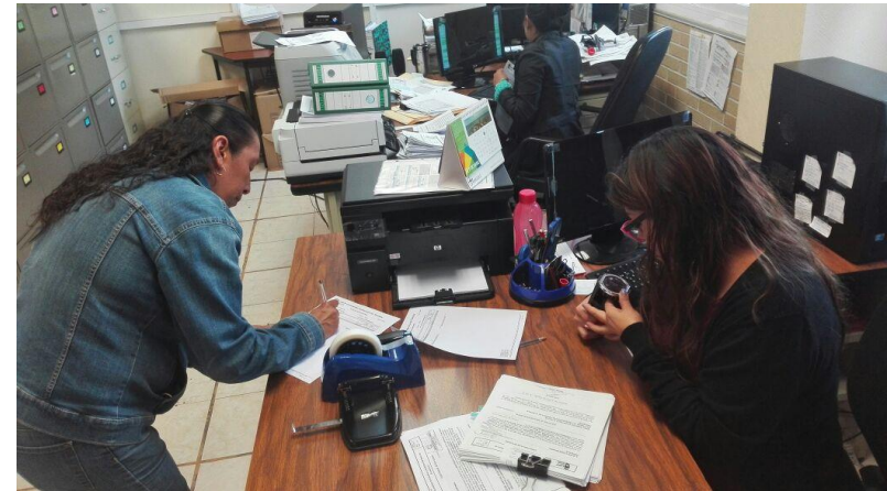
Recepción de actas finales y cierre de cuatrimestre septiembre-diciembre 2015.