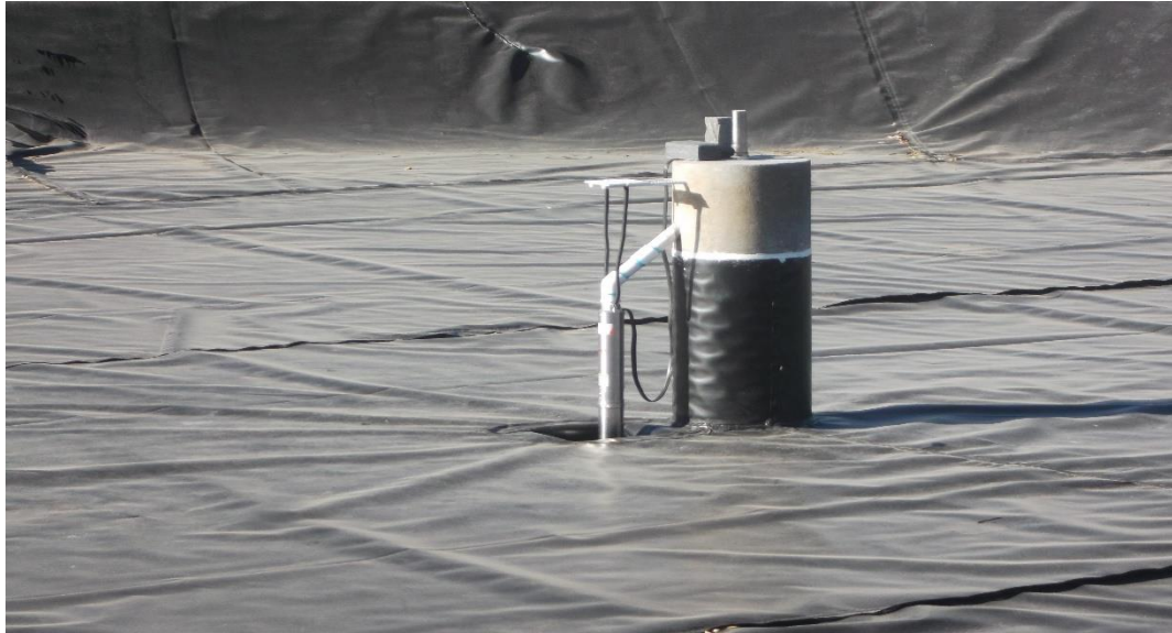
COLOCACIÓN E INSTALACIÓN DE MOTOBOMBA SUMERGIBLE PARA GENERAR EL CHORRO DE AGUA.