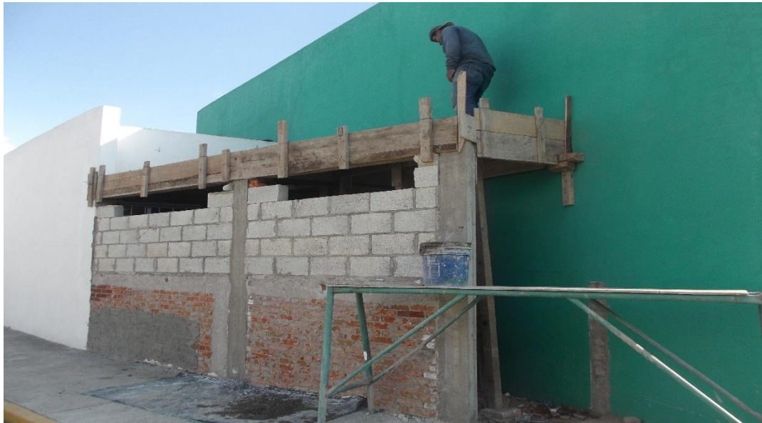
AVANCE DE LA CONSTRUCCIÓN DEL ALMACEN DE REACTIVOS EN EL EDIFICIO LT-2