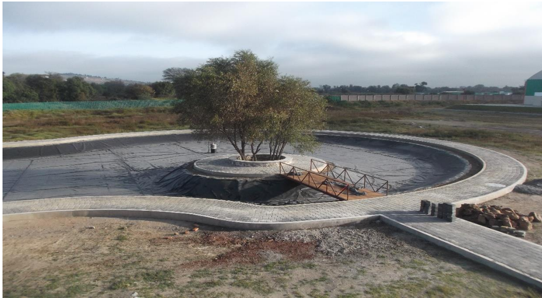
CONSTRUCCIÓN DE PUENTE METÁLICO PARA UNIR ANDADOR PERIMETRAL CON ISLETA EXISTENTE