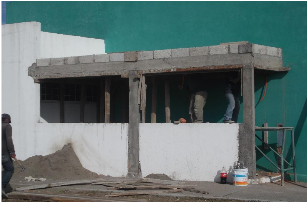
CONSTRUCCIÓN DE ALMACEN DE REACTIVOS EN EL EDIFICIO LT-2 (CUERPO B). CONTARA CON LAS INSTALACIONES PROPIAS, VENTILACIÓN Y ESPACIO ÓPTIMO