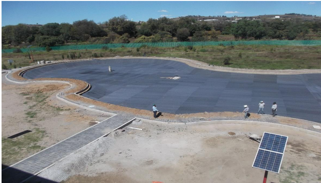
COLOCACIÓN DE MALLA GEOTEXTIL PARA LA PROTECCIÓN DE GEOMEMBRANA DURANTE EL PROCESO