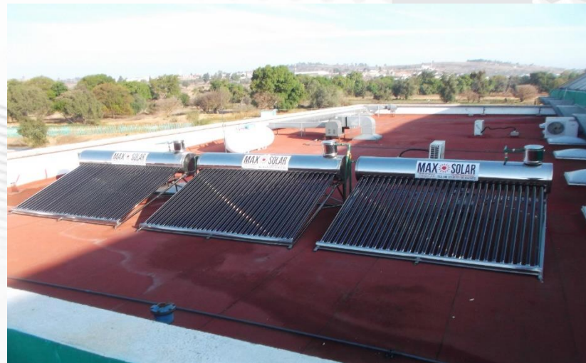
GIMNASIO UNIVERSITARIO: SUMINISTRO, COLOCACIÓN Y CONEXIÓN DE CALENTADORES SOLARES EN AZOTEA DEL GIMNASIO