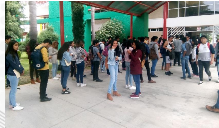
Reinscripción de alumnos regulares al cuatrimestre enero-abril 2019