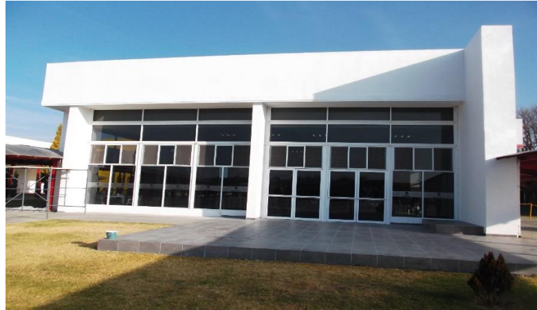
CAFETERÍA: SUMINISTRO Y COLOCACIÓN DE CANCELERÍA COLOR BLANCO LÍNEA 3" CON PUERTAS ABATIBLES EN TERRAZA EXTERIOR