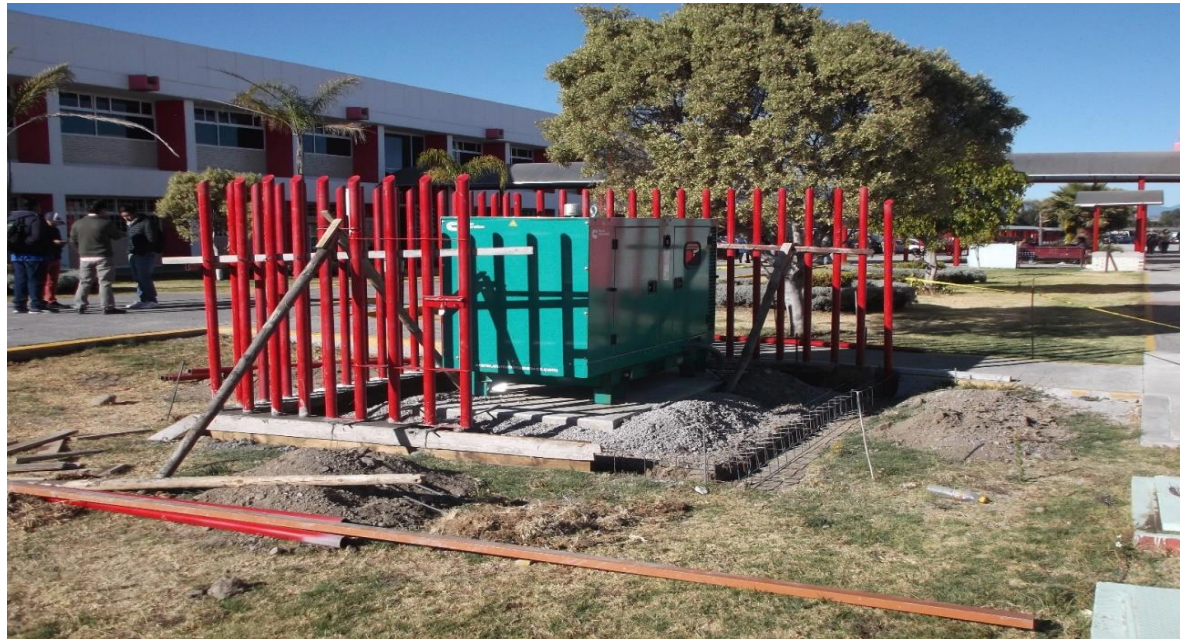
OBRA EXTERIOR: CONSTRUCCION DE CERCADO METALICO PARA PLANTA DE EMERGENCIA