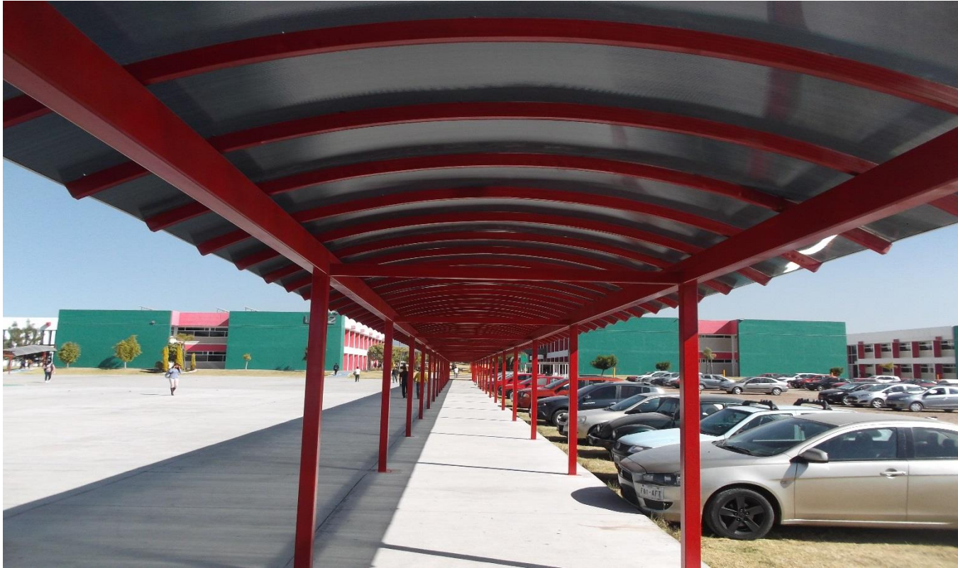
OBRA EXTERIOR: CONSTRUCCION DE CUBIERTA EN ANDADORES A BASE DE ESTRUCTURA METALICA Y CUBIERTA PLASTICA (ANDADOR SUR EXPLANADA PRINCIPAL).