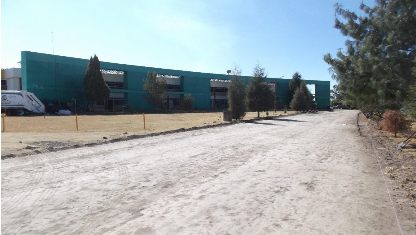
OBRA EXTERIOR: TENDIDO Y COMPACTADO DE BASE HIDRAULICA PARA LA CONSTRUCCION DE CIRCUITO PERIMETRAL INTERIOR A BASE DE GUARNICIONES DE CONCRETO Y ADDQUIN TIPO LAJA 20X20. UBICADO EN LADO NORTE