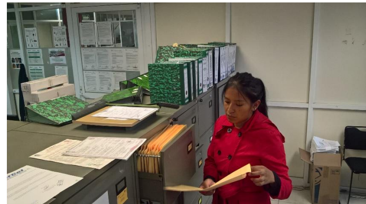
Asignación de matrícula para alumnos nuevo ingreso intermedios