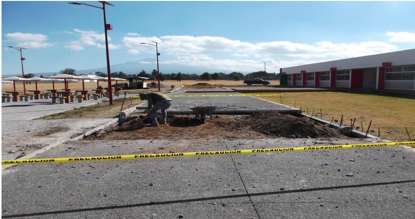
OBRA EXTERIOR: DEMOLICIÓN DE PISO DE CONCRETO PARA LA MODIFICACIÓN DEL ANDADOR EXISTENTE QUE CONECTA A LA EXPLANADA DEL EDIFICIO UD-5.