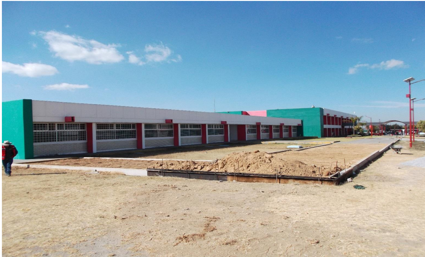
OBRA EXTERIOR: RELLENOS COMPACTADOS Y CONSTRUCCIÓN DE GUARNICIONES DE CONCRETO PARA LA CONTINUACIÓN DEL ANDADOR PRINCIPAL.