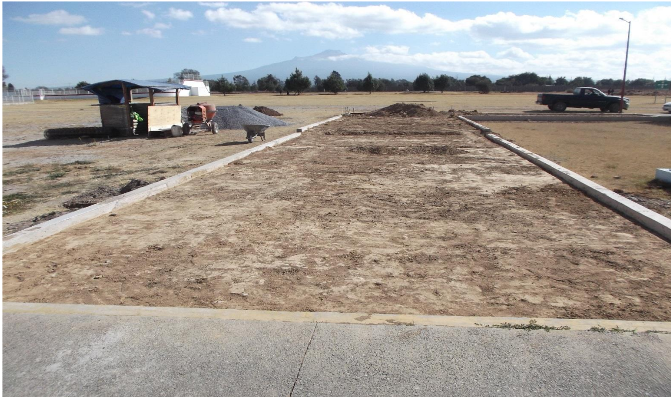
OBRA EXTERIOR: RELLENOS COMPACTADOS Y CONSTRUCCIÓN DE GUARNICIONES DE CONCRETO PARA LA CONTINUACIÓN DEL ANDADOR PRINCIPAL.