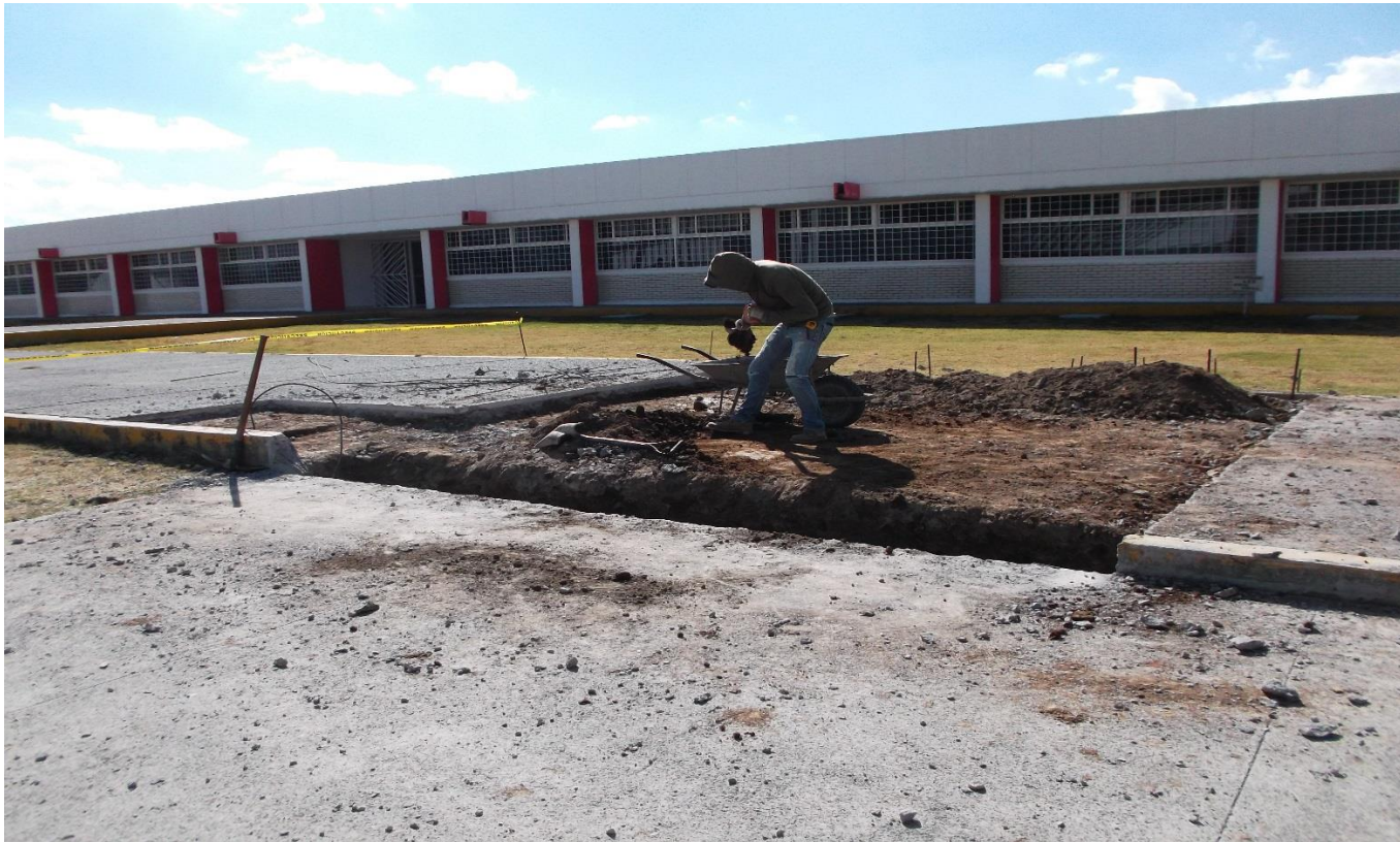
OBRA EXTERIOR: DEMOLICIÓN DE PISO DE CONCRETO PARA LA REUBICACIÓN DE RAMPA PARA DISCAPACITADOS, EN ANDADOR EXISTENTE.