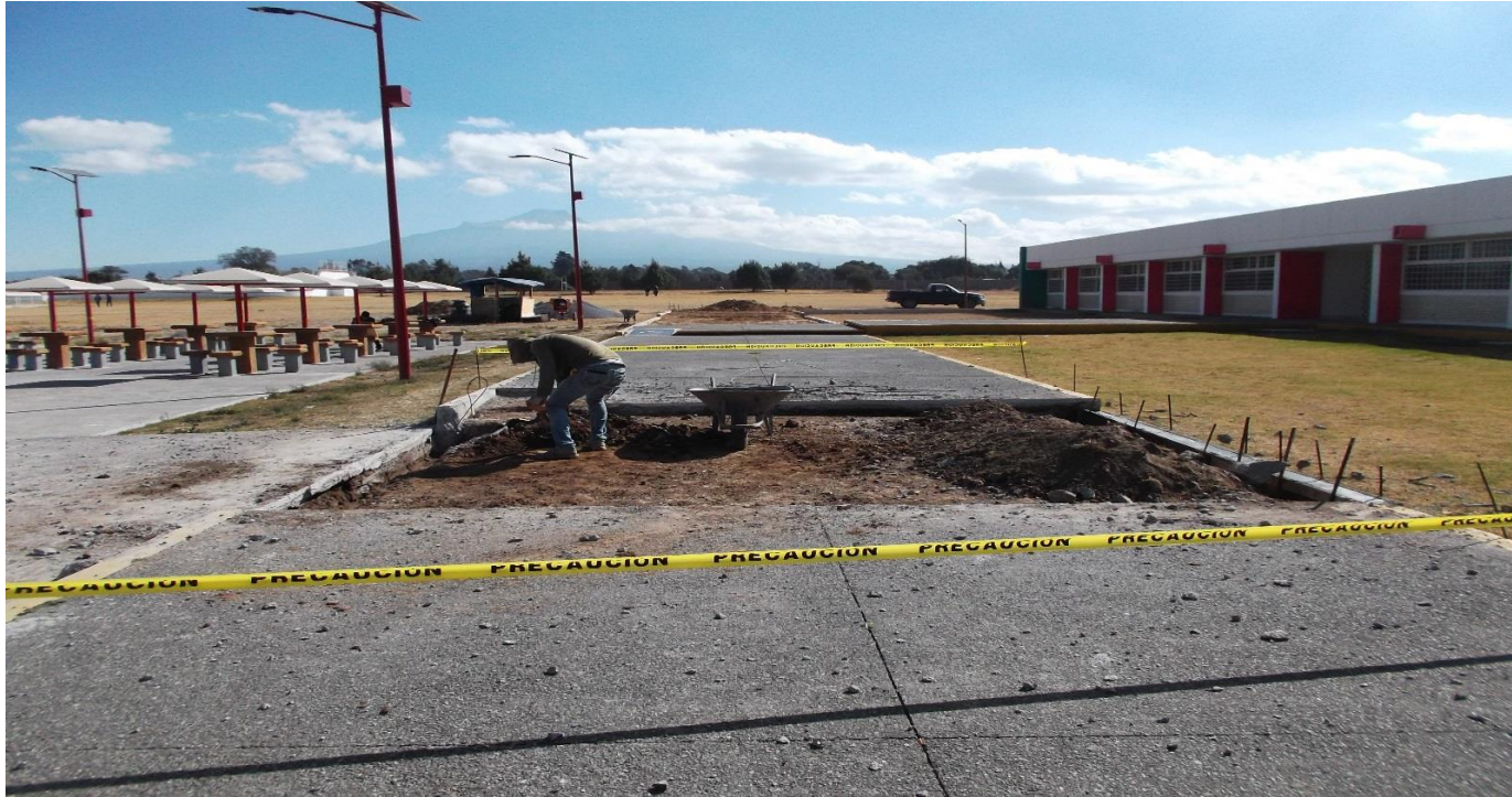
OBRA EXTERIOR: DEMOLICIÓN DE PISO DE CONCRETO PARA LA MODIFICACIÓN DEL ANDADOR EXISTENTE QUE CONECTA A LA EXPLANADA DEL EDIFICIO UD-5.