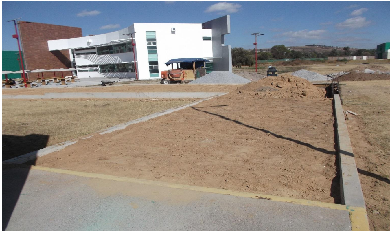
OBRA EXTERIOR: RELLENOS COMPACTADOS Y CONSTRUCCIÓN DE GUARNICIONES DE CONCRETO PARA LA CONTINUACIÓN DEL ANDADOR PRINCIPAL.