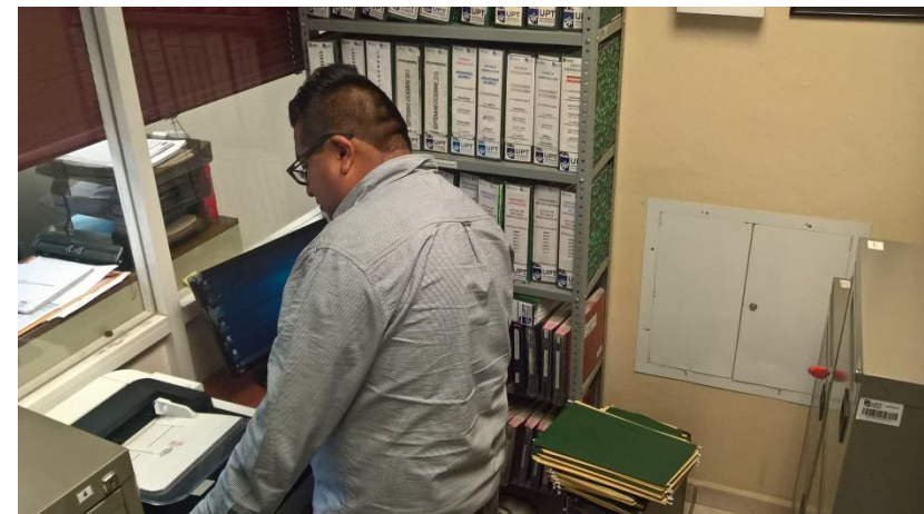
Digitalización de expedientes de alumnos inscritos