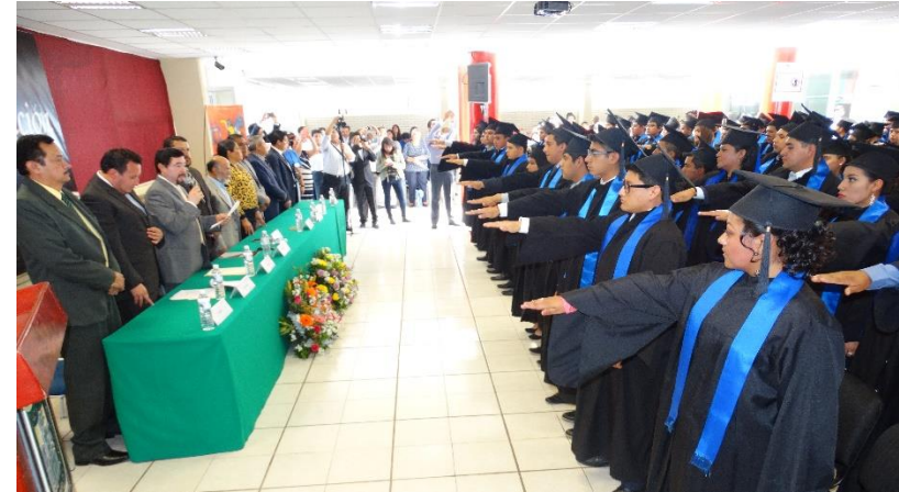
Titulaciones del mes de marzo de 2017