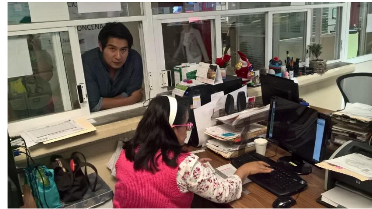
Entrega de fichas a alumnos de nuevo ingreso 2da etapa de convocatoria.