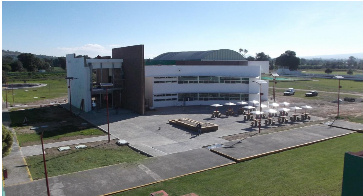
CONSTRUCCION DE MESAS DE TRABAJO EN EXPLANADA PRINCIPAL