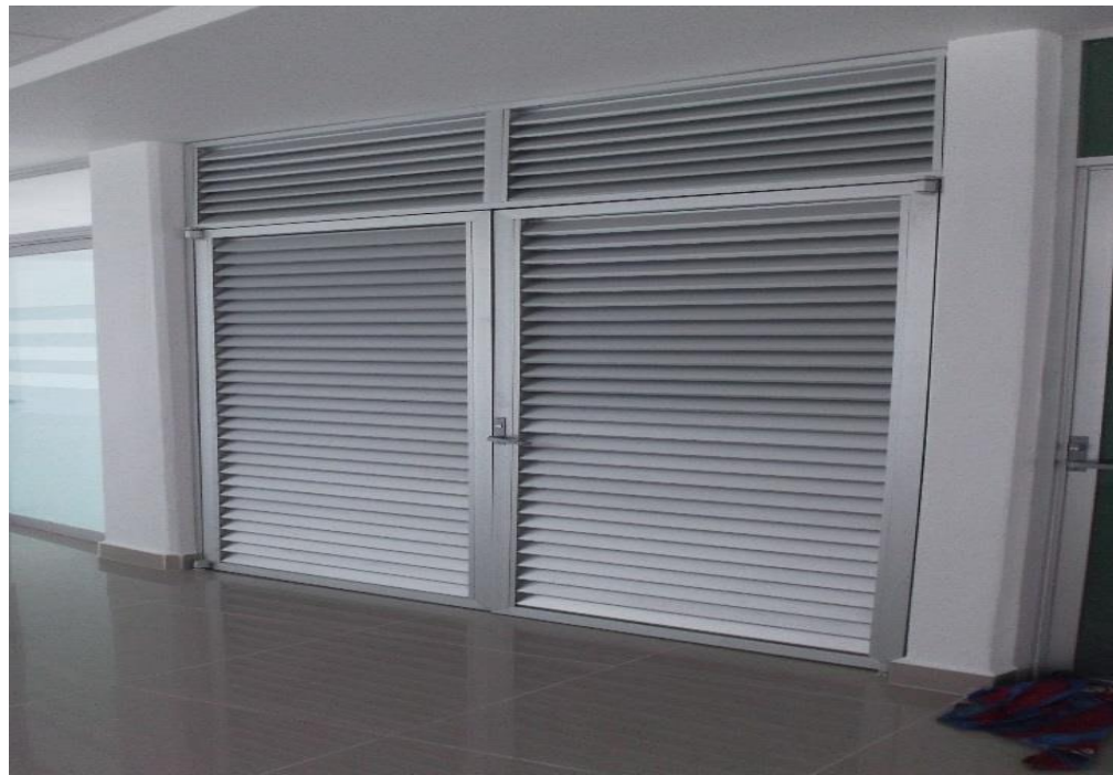
PUERTAS Y FIJOS TIPO LOUVER EN PLANTAS ALTA Y BAJA.