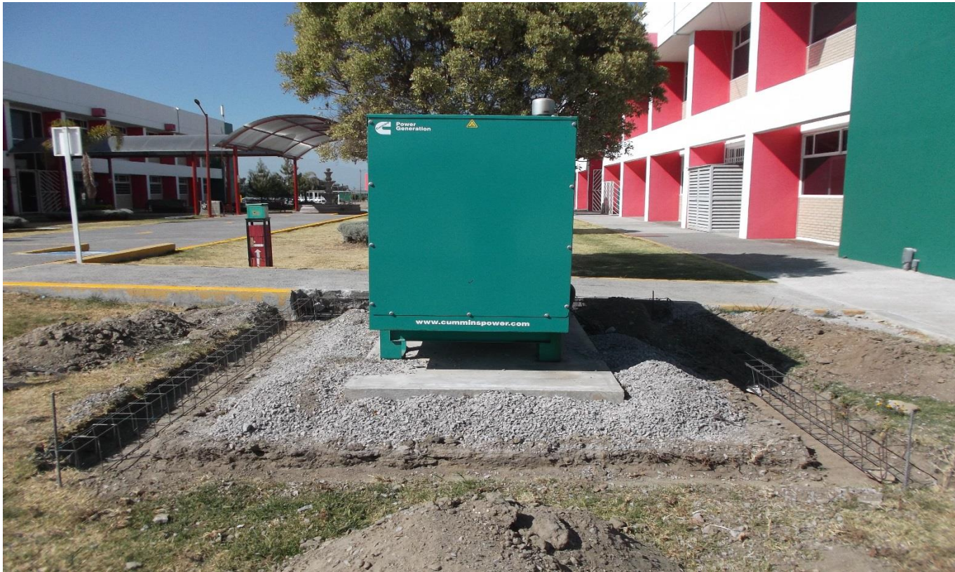
OBRA EXTERIOR: CONSTRUCCION DE CADENA DE CONCRETO PARA RECIBIR CERCADO METALICO PARA LA PROTECCION DE PLANTA DE EMERGENCIA