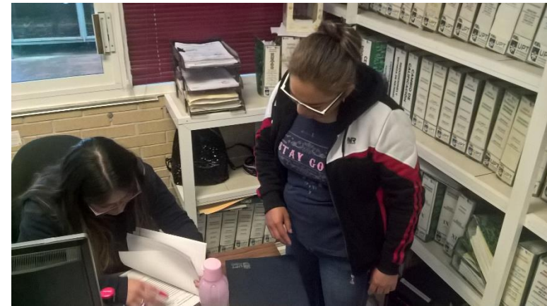
Recepción de actas de evaluación final