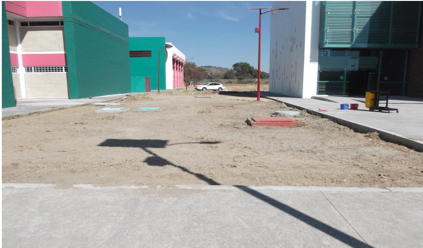
OBRA EXTERIOR: DESPALME EN AREA JARDINADA PARA RECIBIR TIERRA ORGANICA PARA LA CIEMBRA DE PASTO, COSTADO DE EXPLANADA DEL EDIFICIO UD-5