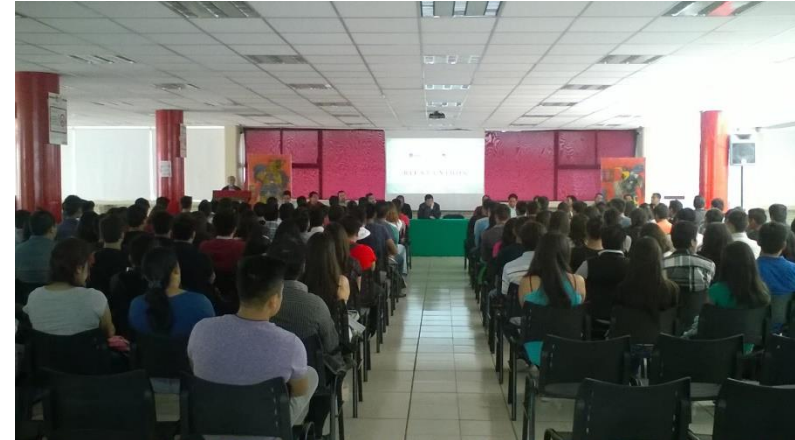
Inscripción y cursos de nivelación de alumnos de intermedios 2018