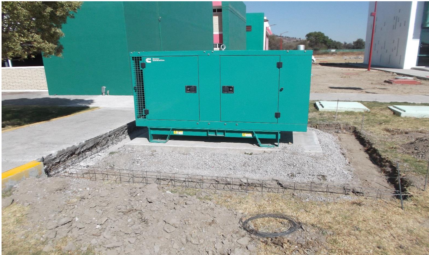
OBRA EXTERIOR: CONSTRUCCION DE CADENA DE CONCRETO ARMADO PARA RECIBIR CERCADO METALICO PARA LA PROTECCION DE PLANTA DE EMERGENCIA