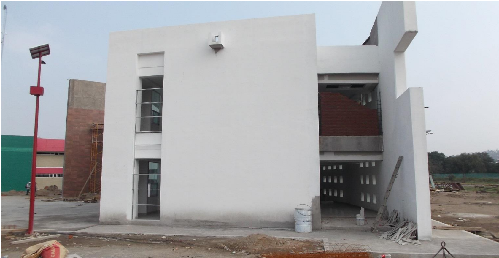
APLICACIÓN DE PINTURA (FONDEO) EN MUROS EXTERIORES.