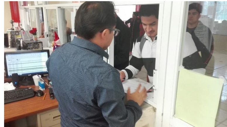
Inscripción de alumnos aceptados de la 1ra etapa de admisión