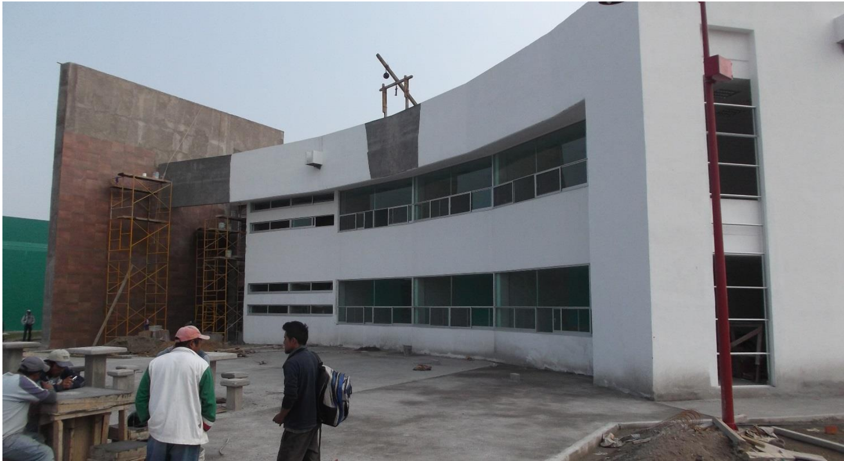
APLICACIÓN DE PINTURA (FONDEO) EN MUROS EXTERIORES.