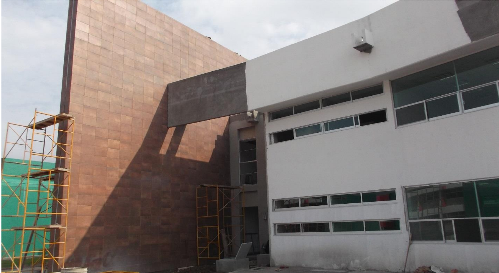
COLOCACION DE REVESTIMIENTO DE CERAMICA EN MUROS EXTERIORES.