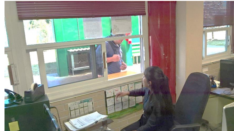
Reinscripción de estudiantes regulares al cuatrimestre Mayo- agosto 2017