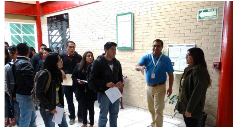
Publicación de Convocatoria de admisión 2da etapa.