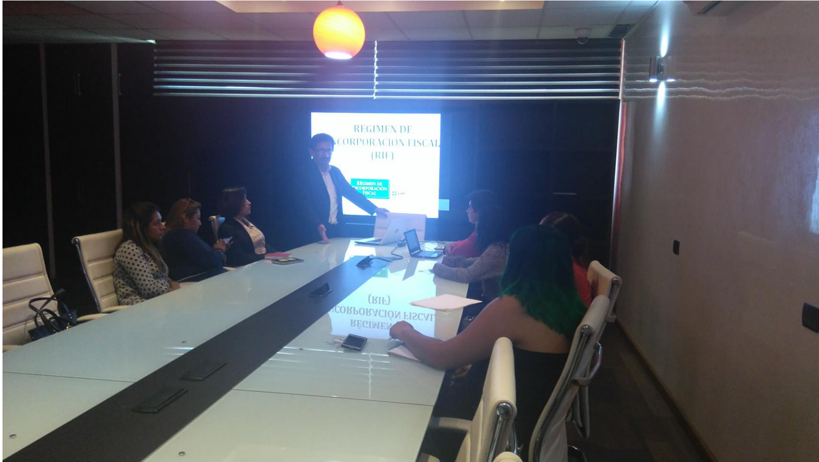
Taller Planeación Fiscal incubandos