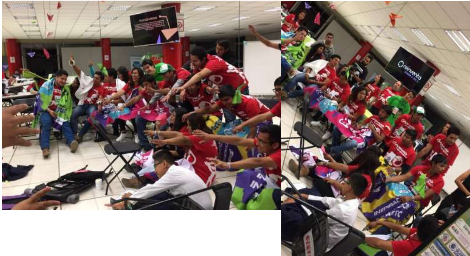
Implementación de las metodologías del modelo REINVENTA 3.0