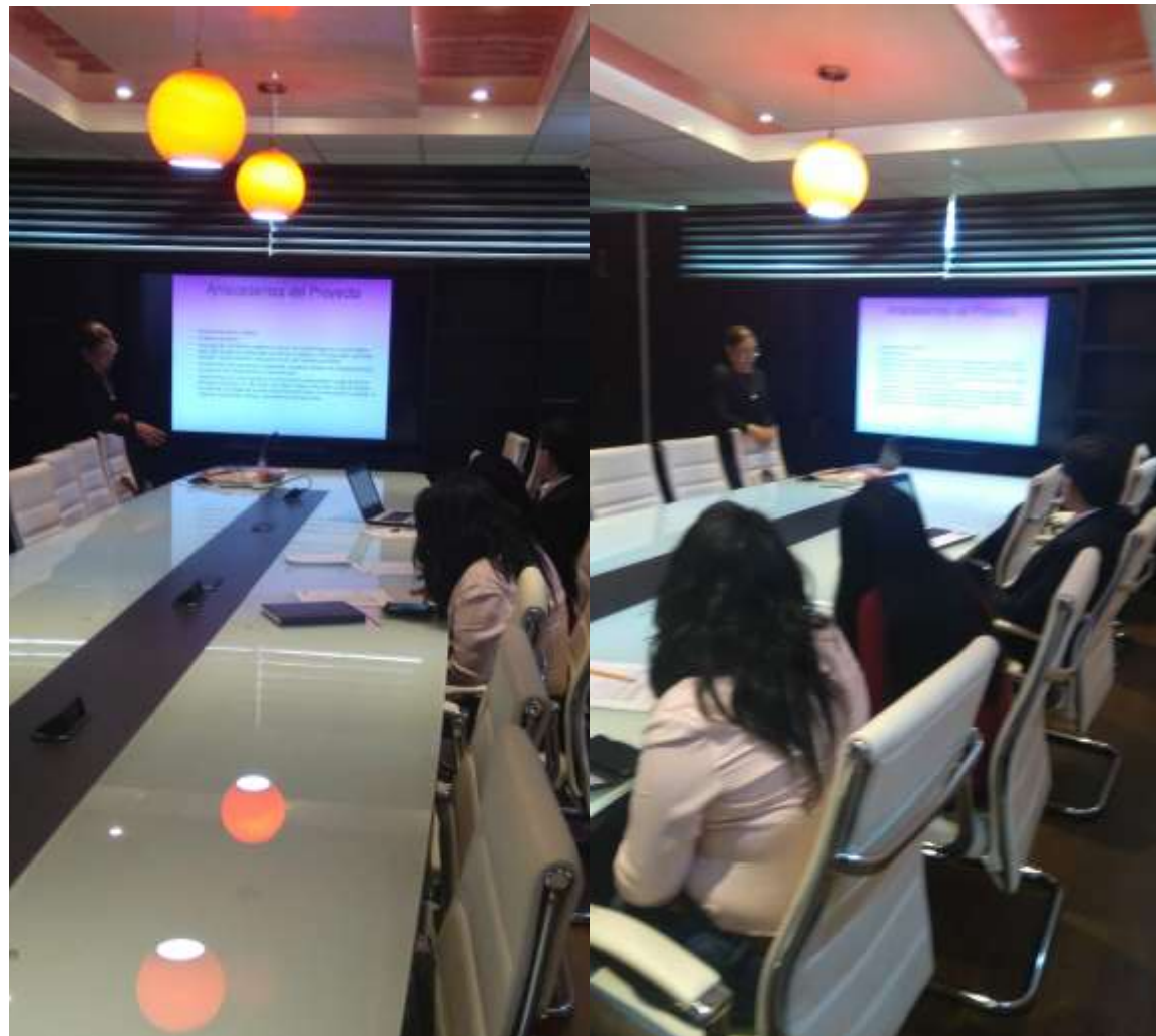
Evaluación del proyecto de Cochinita Pibil