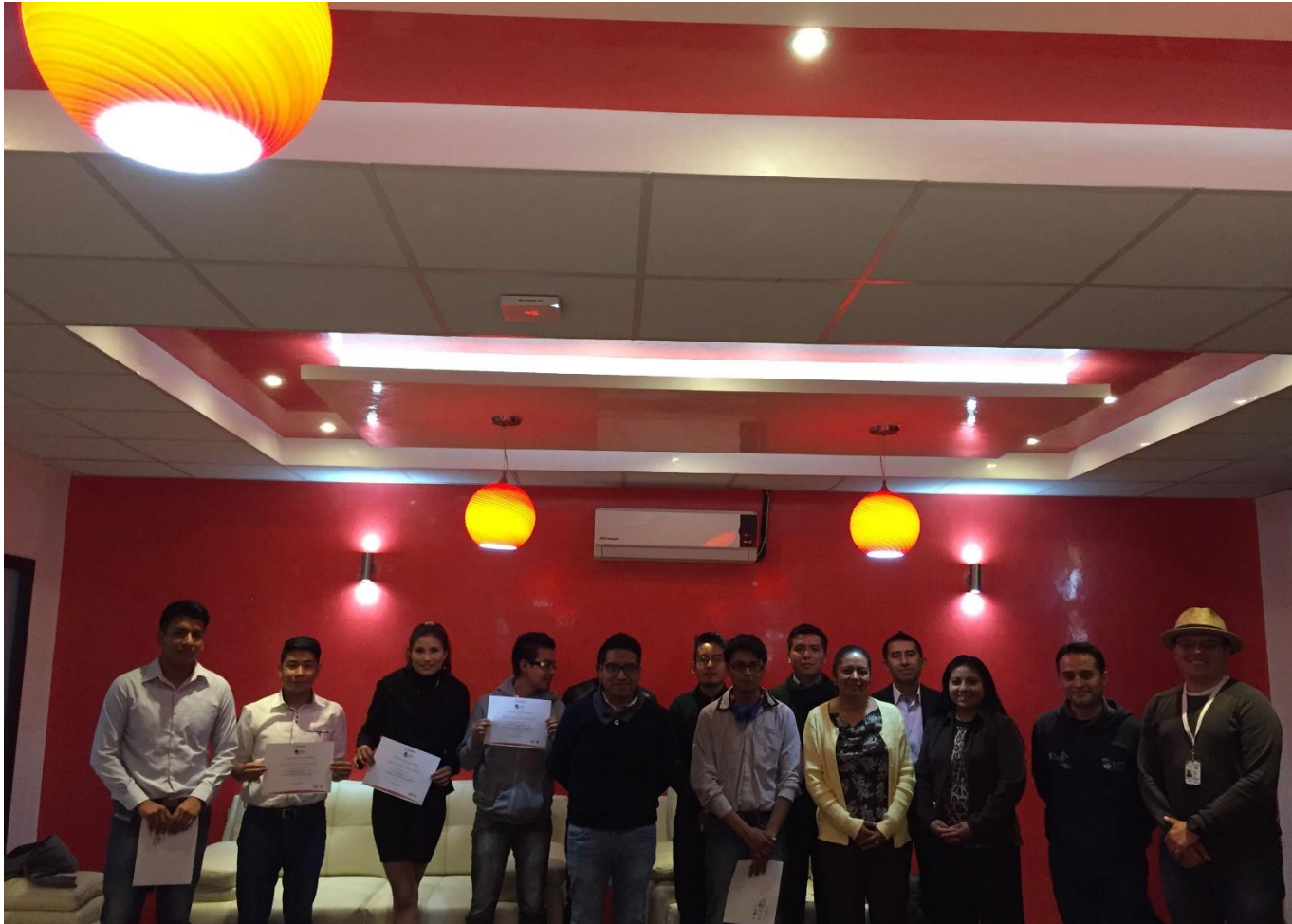
Imagen 3.- 4° Concurso de Incubación de Ideas