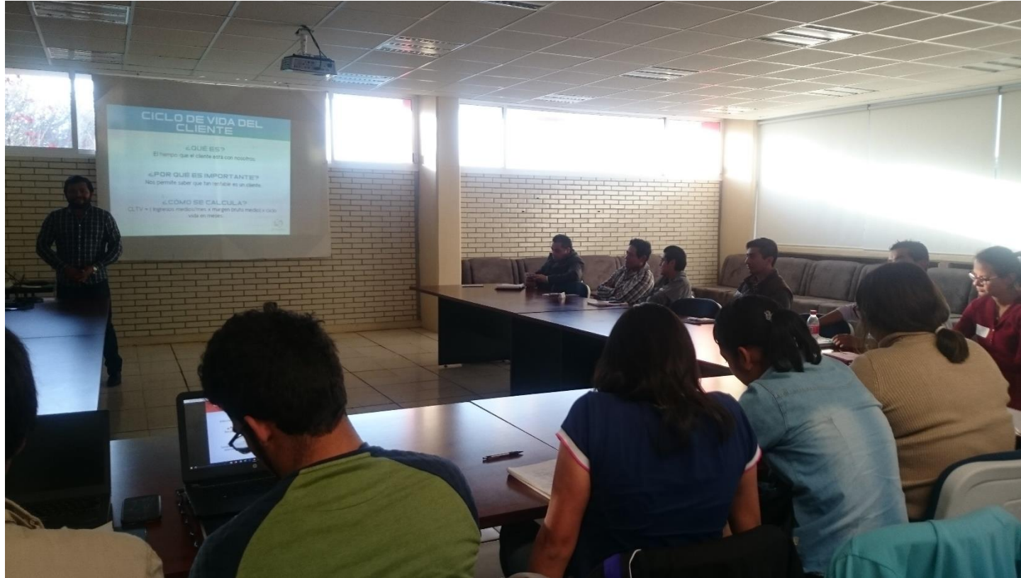
Imagen 1.- Implementación de metodologías INADEM