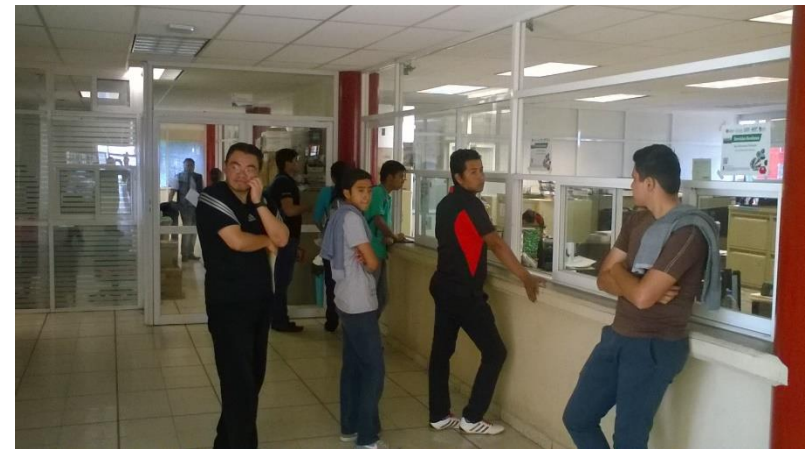
Solicitudes de exámenes de recuperación.