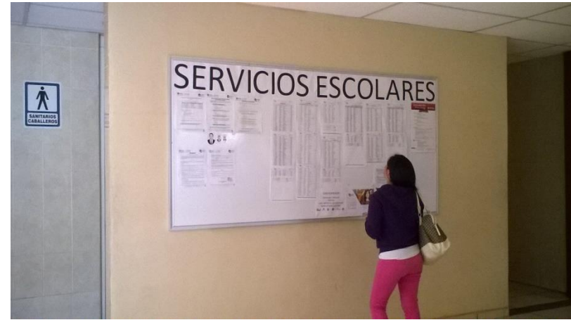
Aplicación de Examen Ceneval ciclo intermedios y publicación de listas de aceptados.