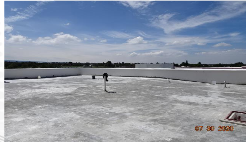
APLICACIÓN DE APLANADOS FINOS CARA INTERIOR DE PRETILES DE AZOTEA

http://sgc.uptlax.edu.mx / rectoria@uptlax.edu.mx