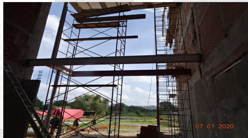
SUMINISTRO Y COLOCACION DE LAMBRIN DE CERAMICA EN SANITARIOS HOMBRES Y MUJERES PLANTA BAJA Y PLANTA ALTA, SUMINISTRO, COLOCACION Y PROCESO DE SOLDADURA DE ESTRUCTURA METALICA EN FACHADAS INTEGRALES NORTE Y SUR.

http://sgc.uptlax.edu.mx / rectoria@uptlax.edu.mx