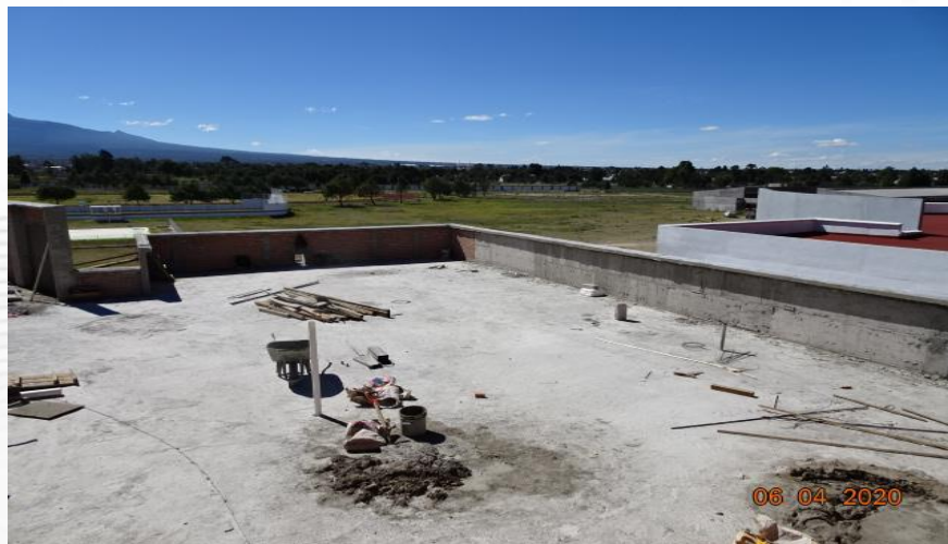
CONSTRUCCION DE PRETILES DE CONCRETO Y REPIZON EN LOSA DE AZOTEA (NIVEL 7.80 M)