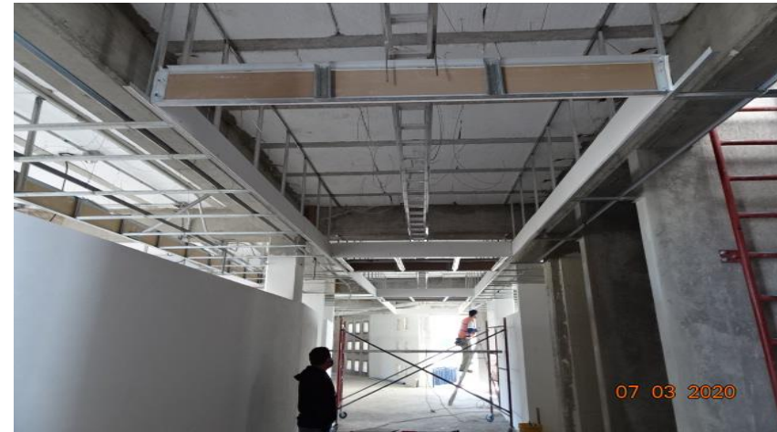
SUMINISTRO Y COLOCACION DE ELEMENTOS METALICOS DE SOPORTE PARA RECIBIR PLAFON ACUSTICO "ECLIPSE CLIMA PLUS" PLANTA ALTA