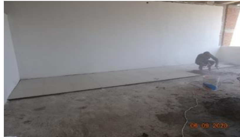
APLICACION DE APLANADO FINO EN MUROS INTERIORES E INICIO DE COLOCACION DE LOSETA DE CERAMICA EN PISOS INTERIORES