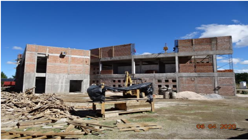
CONSTRUCCION DE MUROS EXTERIORES DE TABIQUE ROJO RECOCIDO