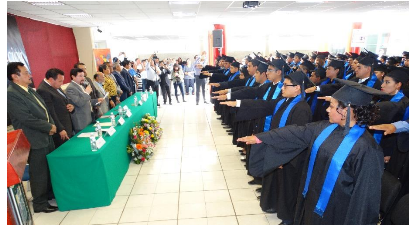
Titulaciones del mes de marzo de 2017