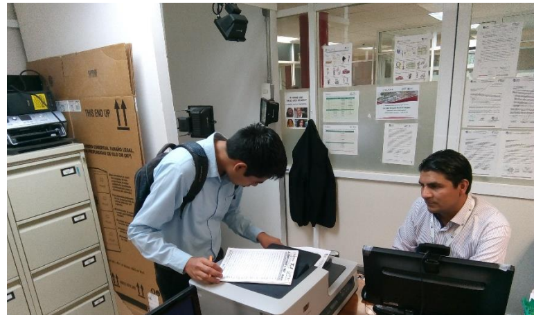
Troquelado de vigencia en credenciales.