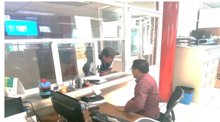
Reinscripción de alumnos regulares al cuatrimestre enero-abril 2018