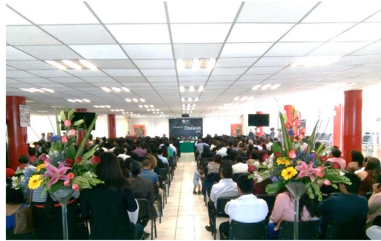
Titulaciones del mes de marzo 2018