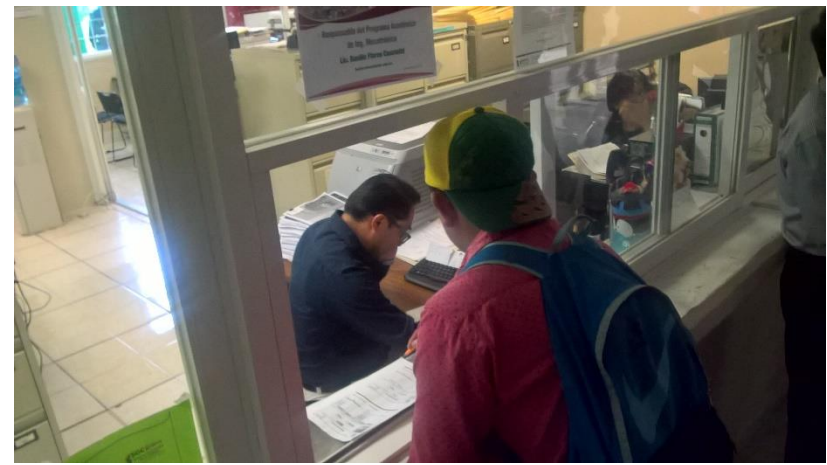
Solicitud de exámenes de recuperación 2da etapa y solicitudes de bajas de asignatura