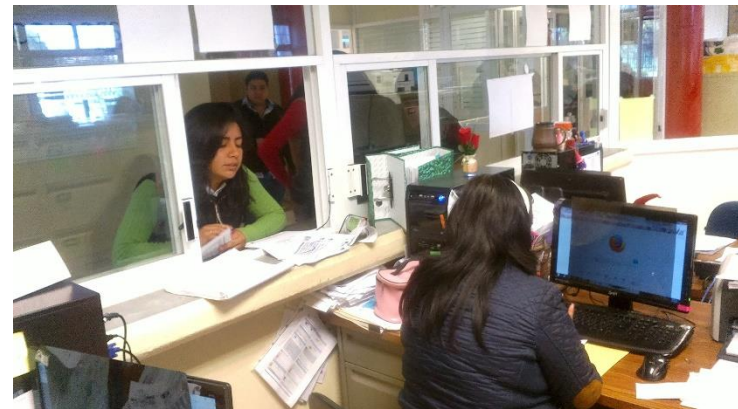
Recepción de documentación para tramite de cedula profesional.