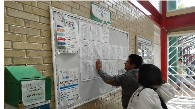
Campaña de toma de fotografía para entrega de credencial y publicación de convocatoria.