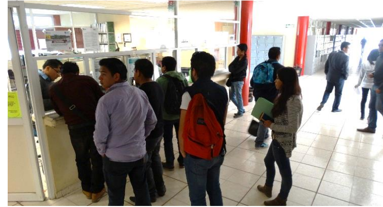
Solicitudes de Beca de Excelencia y reinscripción de alumnos a siguiente cuatrimestre.