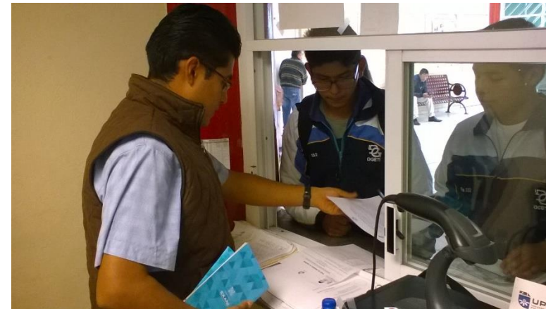
Entrega de fichas de nuevo ingreso y solicitudes de baja de asignatura.