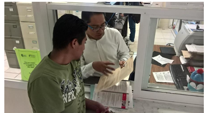
Recepción de documentación para tramite de cedula profesional-