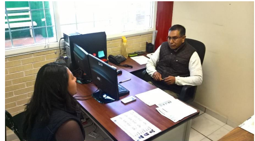
Reinscripción de estudiantes al cuatrimestre Enero- Abril 2017.